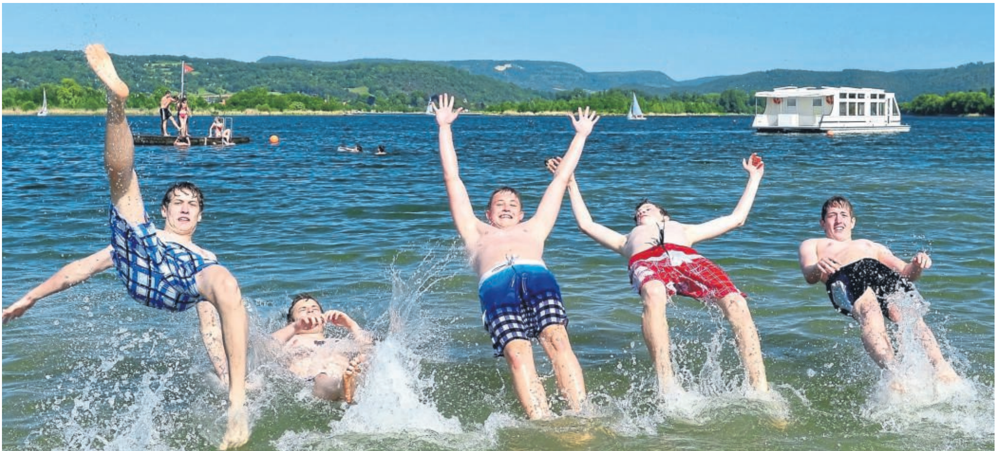
Badespaß am ehemaligen Kiessee: Mittlerweile ist der Werratalsee ein Naherholungsgebiet für Mensch und Tier, auf dem auch ein Elektro-Ausflugsboot fährt.