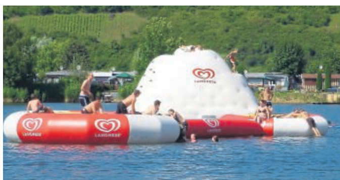
Baden im Meinhardsee: Alle Attraktionen sind nur wenige Schritte voneinander entfernt.