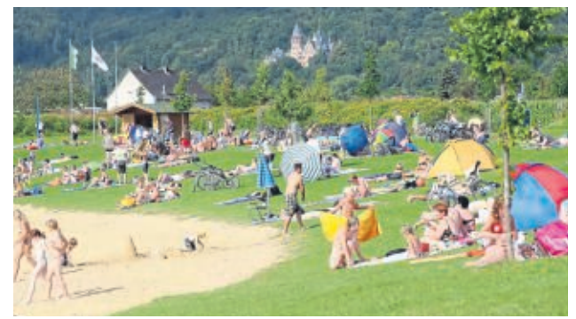
Der Strand am Ostufer bei Schwebda ist der größere Badebereich des Werratalsees.

■ Anfahrt: Es gibt drei große Parkplätze in unmittelbarer Nähe des Ufers, über die man den Werratalsee anfäh-